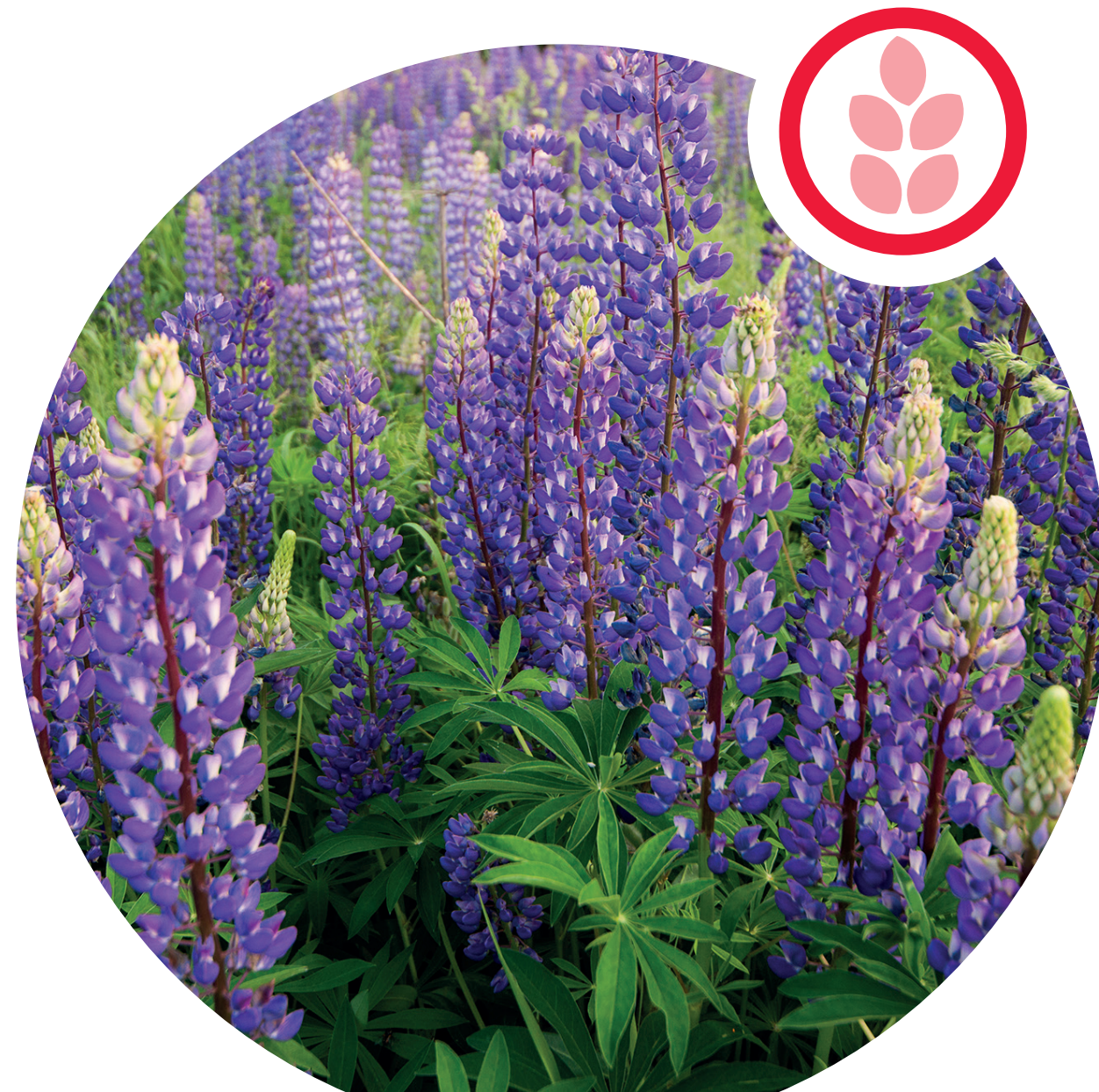
Lupin à folioles nombreuses