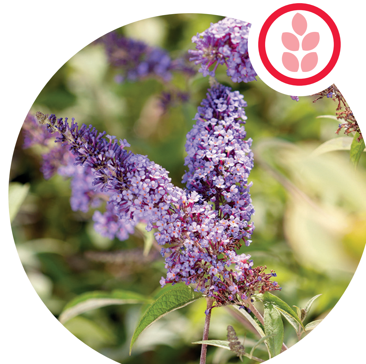
Buddléia de David