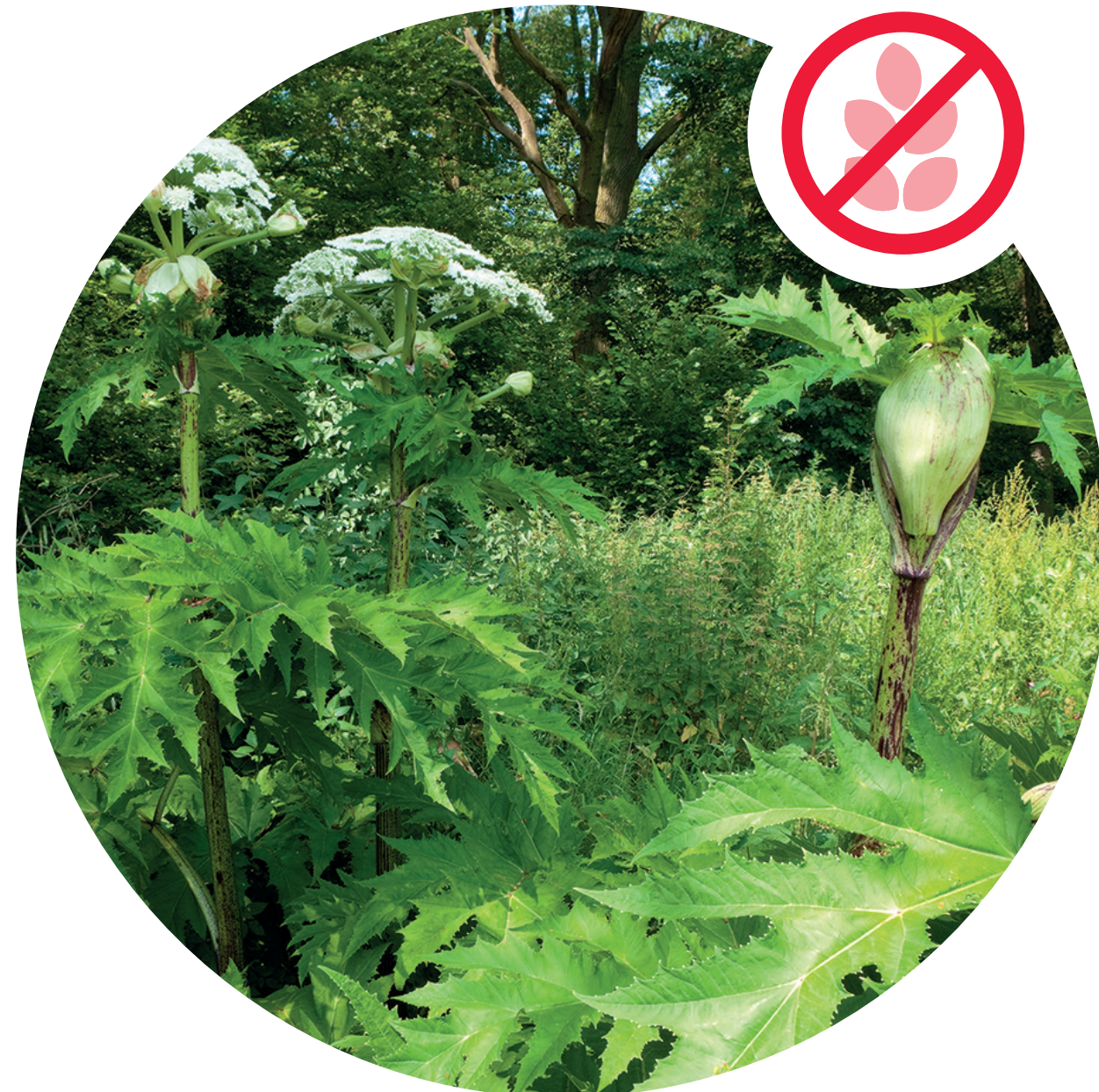
Berce du Caucase