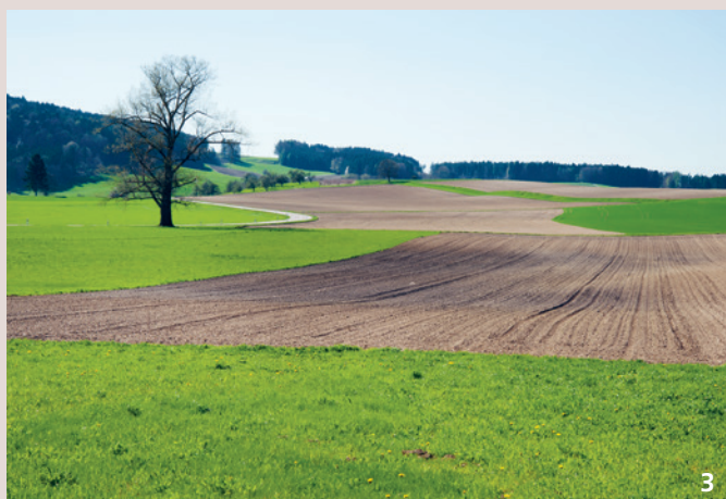
Image 2 : Paysage de Moraine avec une teneur en matière organique plus élevée dans les dépressions humides (premier plan), reconnaissables à la couleur plus foncée du sol.

Dans les paysages vallonnés, divers processus ont entraîné des variations considérables : d'une part par réarrangement de la terre (érosion et accumulation) et d'autre part par enrichissement en matière organique dans les dépressions autrefois hydromorphes et aujourd'hui drainées, (image 2). Les sols organiques qui se sont développés à partir de tourbe ont une teneur très élevée en matière organique mais l'épaisseur des couches organiques peut fortement varier. Après un assainissement, ces sols s'affaissent et avec l'oxygénation, commence une dégradation biologique régulière de la matière organique en CO 2 . La couche organique disparaît, la teneur en matière organique diminue et la partie minérale augmente : le sol se forme peu à peu.