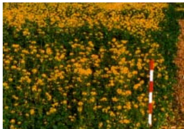
Abb. 9: Blühender Gelbsenf.